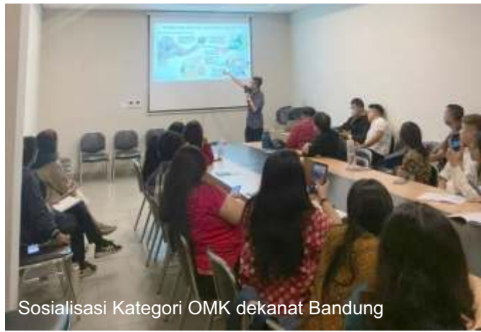
Sosialisasi Kategori OMK dekanat Bandung

Gerakan pertobatan melalui doa, pantang, dan puasa dalam Aksi Puasa Pembangunan (APP) diarahkan tidak hanya untuk kesalehan pribadi, tetapi juga demi kesejahteraan masyarakat, terutama bagi mereka yang kecil, lemah, dan tersingkir.