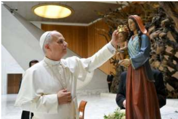
Paus Leo XIV memasang mahkota pada patung Maria dan Bayi Yesus selama pertemuan dengan peserta “Jubilee of the Roma, Sinti and Traveling Peoples” di Aula Audiensi Paulus VI di Vatikan pada 18 Oktober 2025.