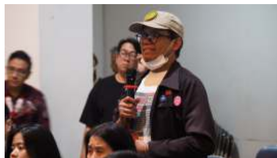
Sesi tanya jawab