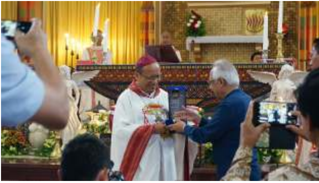
Pemberian ucapan terima kasih