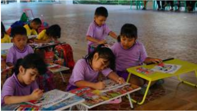
Lomba menggambar dan mewarna