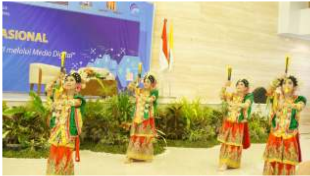
Tarian Menjelang Seminar Nasional