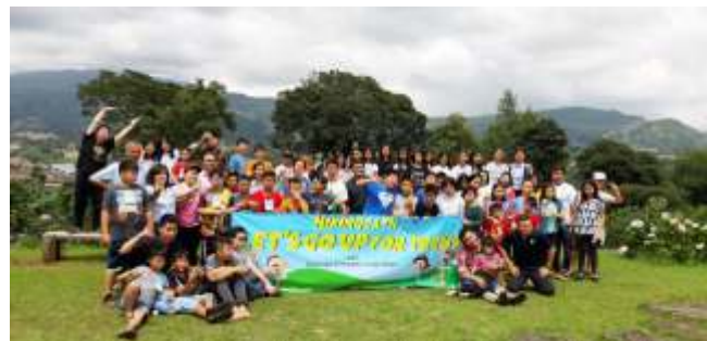
Kegiatan Komunitas Emmanuel