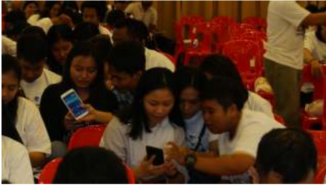
Aktivitas dalam Seminar Nasional