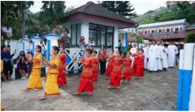
Penyambutan di Tana Toraja