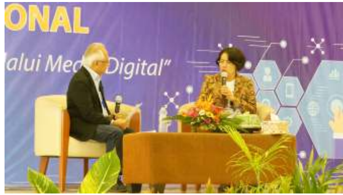
Seminar Nasional dengan tema “Memperkokoh NKRI melalui Digital”