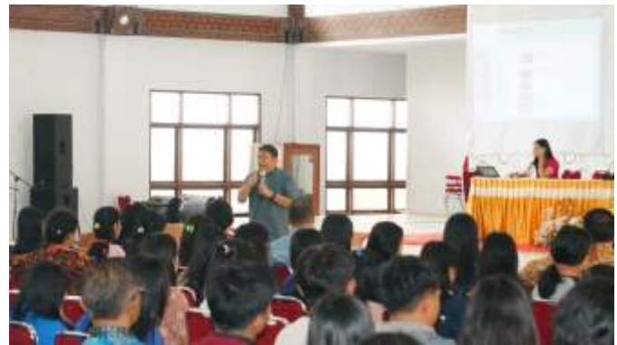
Seminar Literasi Media